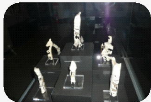
グリーンランドの皇室コレクション