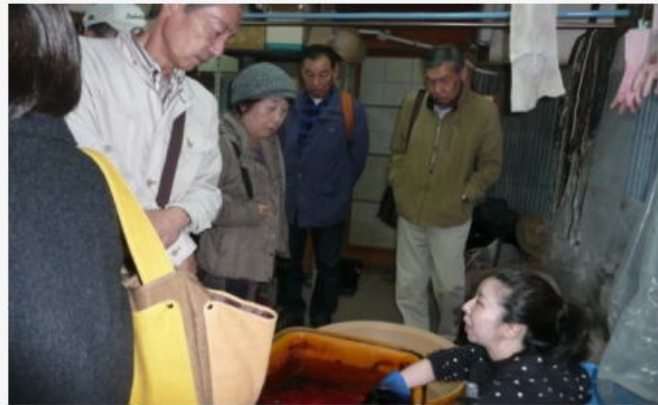
休むことなく手攪拌で染作業をするお弟子さん

東大寺の会式に使う「楕の原紙」は、「紅花5kgで約30cm 角の和紙1枚」しか染められないとお聞きし、感嘆しきり。他にも会式で使う「石清水八幡宮 放生会の12種の花」、北野天満宮の梅 等々、日本の歴史文化を支える工房を見学できた印象深い見学会でした。 公開講座「日本文化の再発見」教務