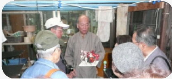
先生の手薬師寺花会式の「草木染花」