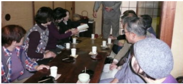
吉岡先生より説明を受ける