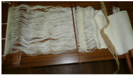
酒野先生が復元された織布