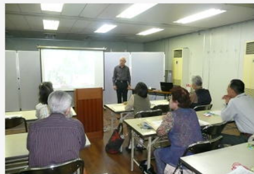
日本民家集落博物館 井藤館長講演