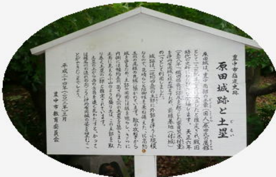
原田城跡と土塁の立札

阪神大震災を潜り抜けた広い邸宅内を案内して頂き、昭和初期の数寄屋風を取り入れた住宅を見学しました。