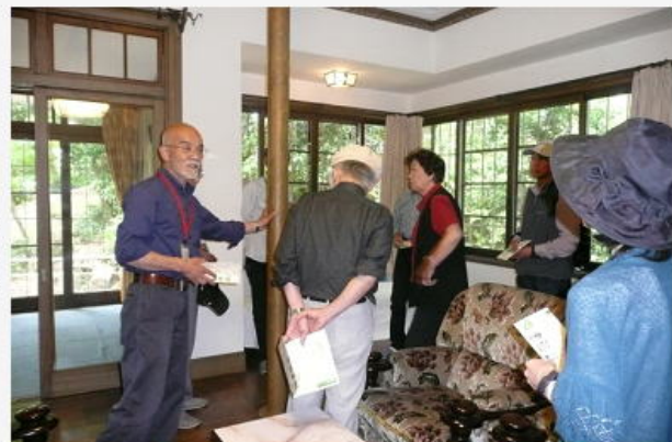
ボランティアガイドさんの説明で資料館見学