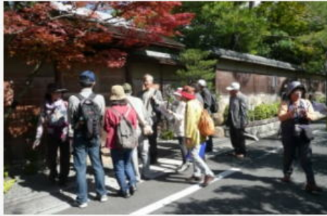
紅葉も美しい南禅寺界隈の別荘地