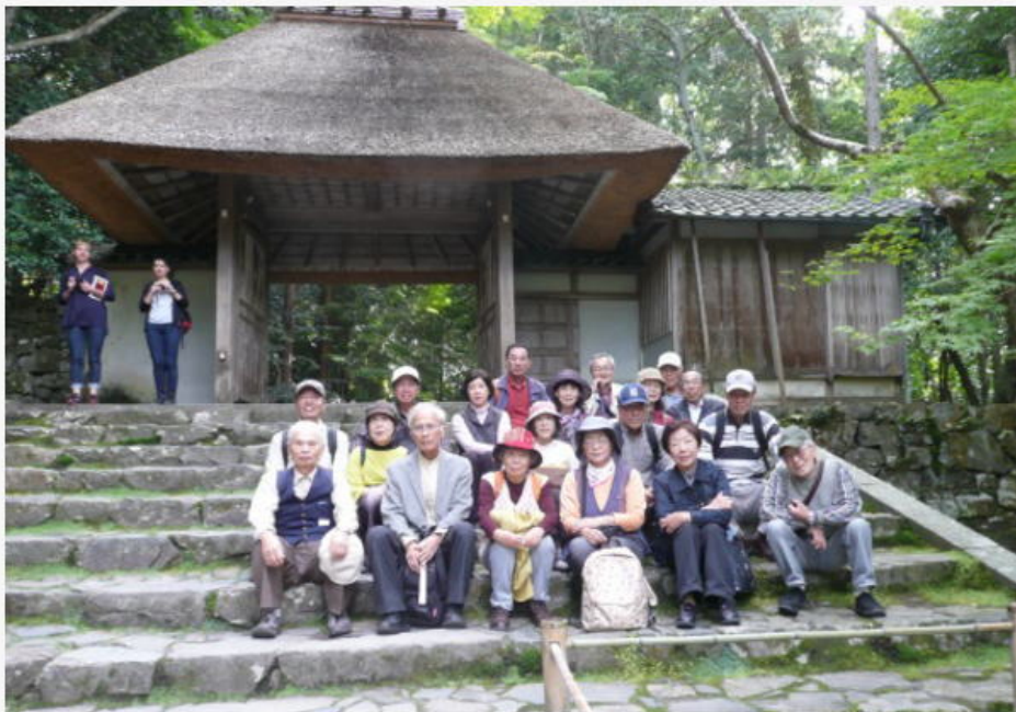
本日最後の目的地「法然院」にて