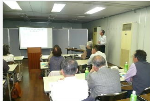
オリエンテーション風景

講義の後、オリエンテーションに引続き、自己紹介…ミシン縫製(男性)・バンドマン・有機栽培野菜づくり・ヘルパー有資格者・老人会会長・少年野球監督・手品師等々、多士済々の仲間が集合、これからは楽しい講座になること間違いなしと、心強い限りです。