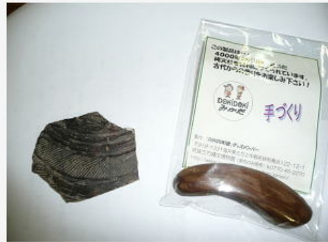
縄文土器片と4千年前の杉の木製品

「縄文時代は母系社会」で争いはなし。稲作文化が定着した「弥生時代は父系社会」に入り集落間の争いが起こる。現代の世情と変わらないこと？を再認識。