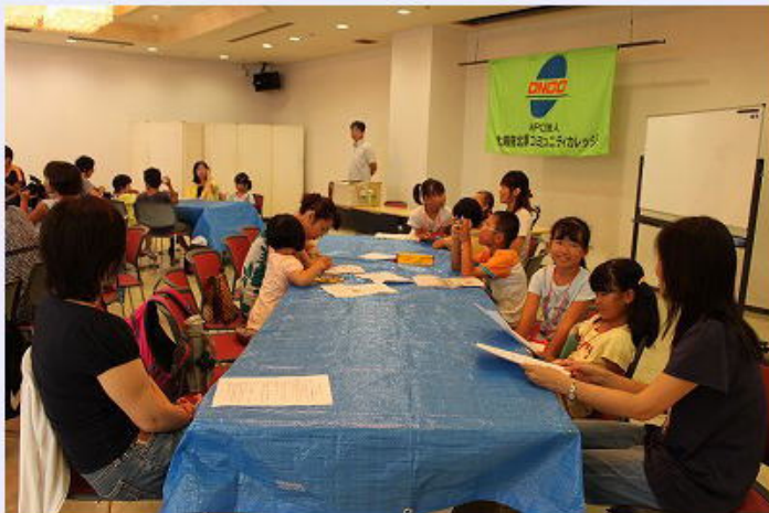
科学実験「燃えるってなあ-に」