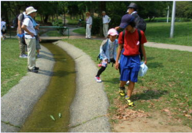
作った笹舟を流して