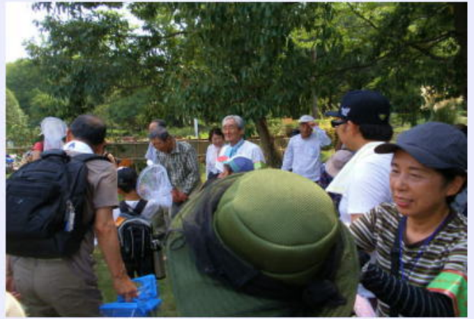
探検隊の皆さま ありがとうございます