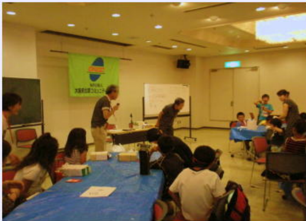
みんなで手作りおもちゃ ～牛乳パックで作る からくり絵本～ “ウサギとカメ”