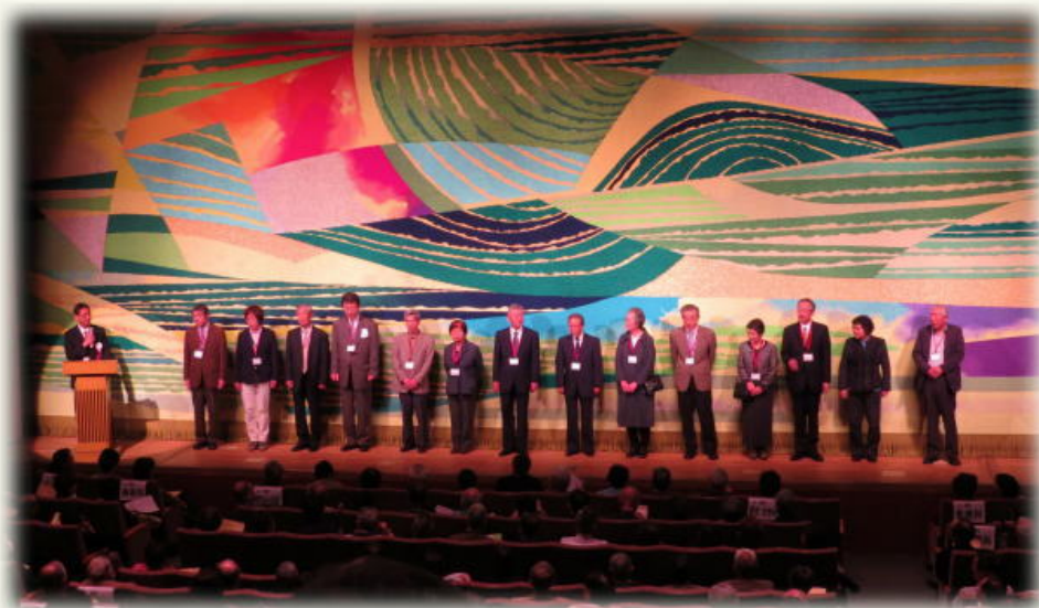
3期生クラス教務担当の紹介