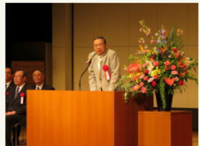
ご来賓代表ご祝辞