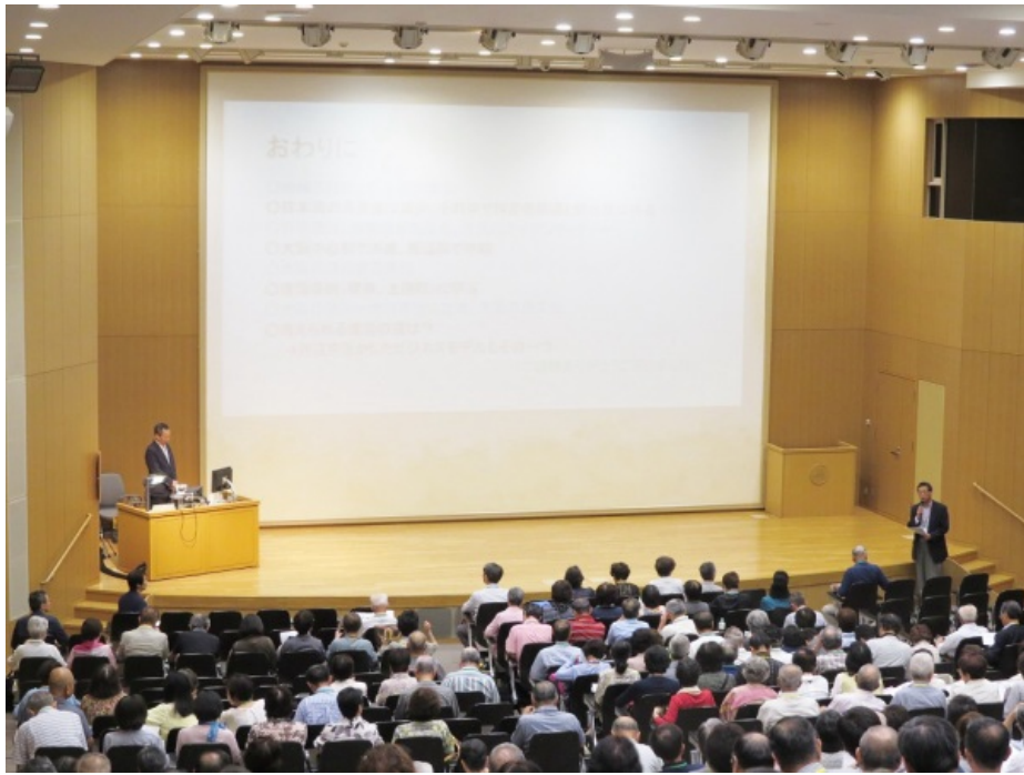
猪谷理事長よりお礼のあいさつ