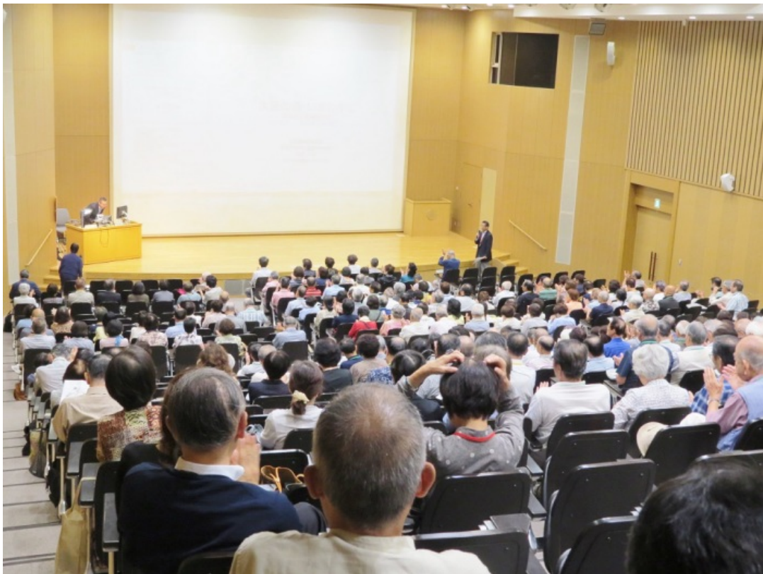
大きな拍手でお礼