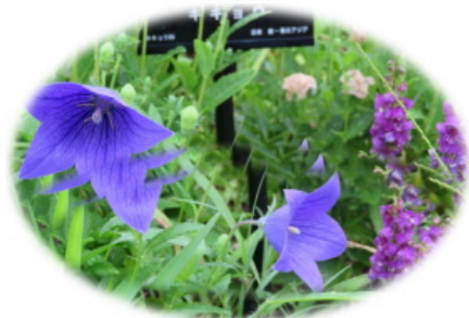
学内通路わきの桔梗とマトリカリア